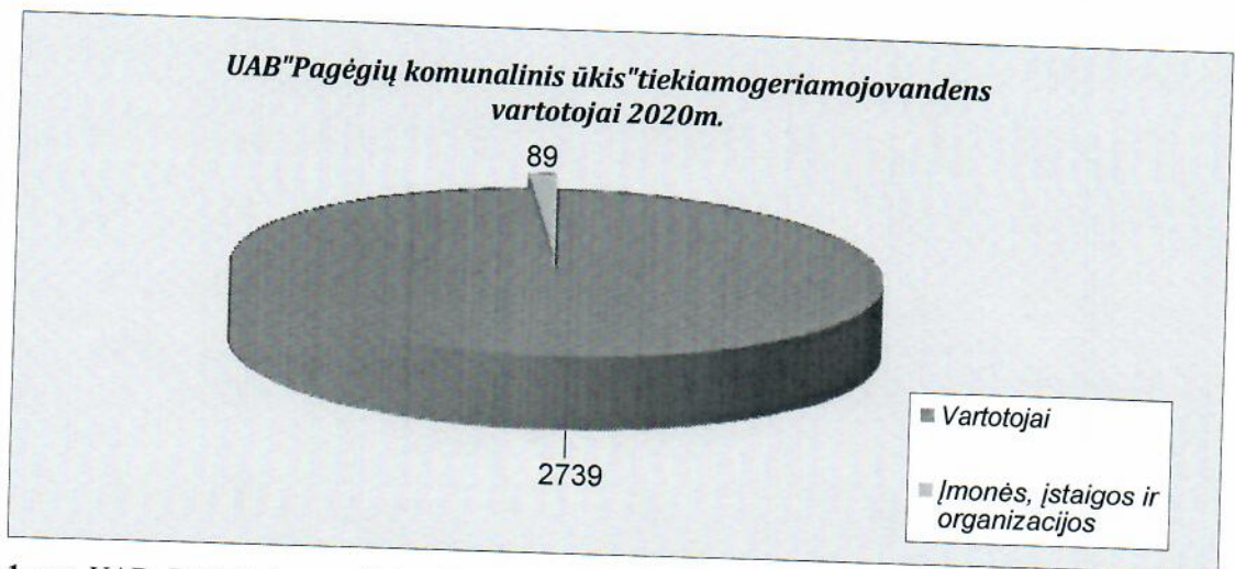
1 pav. UAB „Pagėgių komunalinis ūkis“ tiekiamo geriamojo vandens vartotojai 2020 m. (vienetais).

Vandens gavyba, gerinimas, tiekimas. UAB „Pagėgių komunalinis ūkis“ geriamojo vandens tiekimo paslaugomis 2020 metais naudojosi 2739 vartotojai, 89 įmonių, įstaigų bei organizacijų.